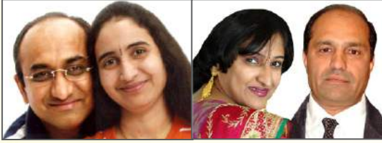
આશિષ - ભાવના

Best wishes and congratulations to Dad - Mom / Baa - Daadaa